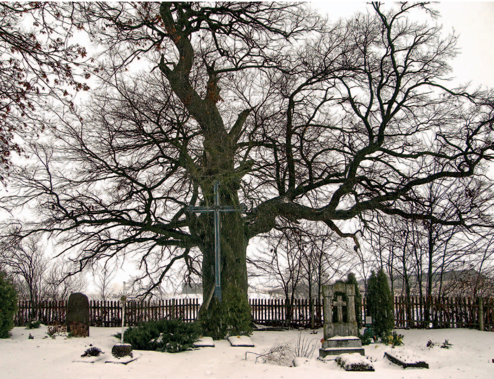
Žadeikonių kapeliuose (Pasvalio r.) augantis šventas ąžuolas. 2009 m.

ąžuolas, kapų eilės čia prasideda sulig medžiu. Medine tvora aptvertos kapinės su varteliais rytų pusėje sudaro šventovės po atviru dangumi vaizdą, ąžuolas vakaruose užima dievybei skirtą vietą (7 pav.). Vietos gyventojai lig šiol pasakoja apie Straigį, kuris senatvėje mėgdavęs kartoti: „Mane po ąžuolu palaidokite.“ 6