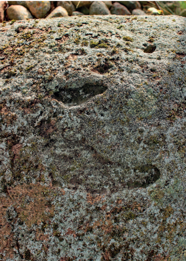
Dvi iš keturių dievų pėdų ant Vilkelių akmens (Panevėžio r.). 2015 m.