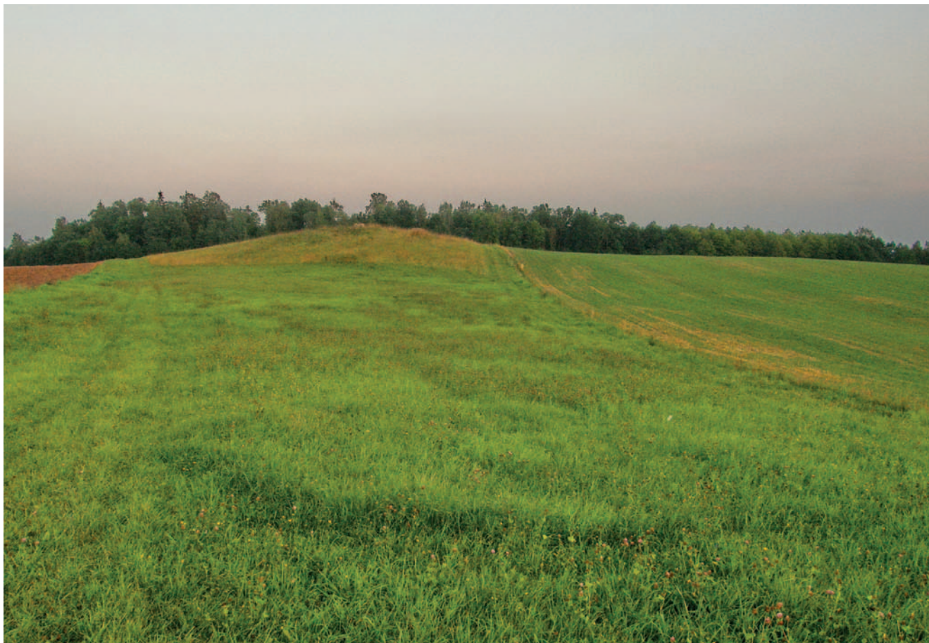
Žolės ratas Voskaičių Maldų kalno papėdėje (Kėdainių r.). 2014 m.

Grįžtant prie dievų ženklų šventvietėse, reikia pabrėžti, kad jie pasižymi didele įvairove. Atidus žvilgsnis rodo, kad šie ženklai turi daug bendro ir yra susiję su mitologiniu mūsų pasaulio ribos arba kito pasaulio angos, tenlink vedančio kelio vaizdiniu. Jis neabejotinai apima pėdomis vadinamus įdubimus šventų akmenų paviršiuje, nesvarbu, ar jie yra ankstyvųjų metalų laikotarpio paveldas (iškaltos, išgludintos apskritos duobutės), ar gamtinės kilmės žymės akmenų paviršiuje. Pėdos likusios ten, kur būta dievų: ateita, stabtelė-