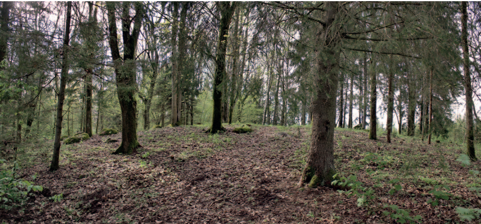
Viena iš daugelio baltų šventviečių atodangų – pastaraisiais metais atverta Akmenų Perkūnkalnio aikštelė (Kelmės r.). 2015 m.