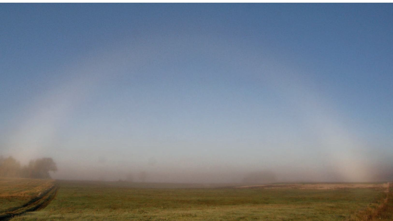
Rūko lankas virš Šliktinės aukojimo vietos (Skuodo r.). 2012 m.