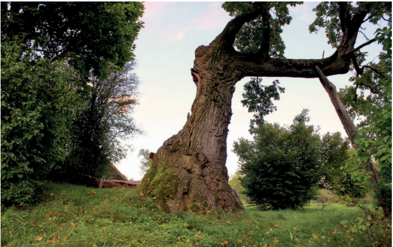
Daugelį metų Milžinkapiu vadinamas Sandariškių (Biržų r.) pilkapis ir ažuolas dalinasi šventumu, bet likusi išlūžusio medžio kamieno dalis ilgainiui sunyks. 2015 m.